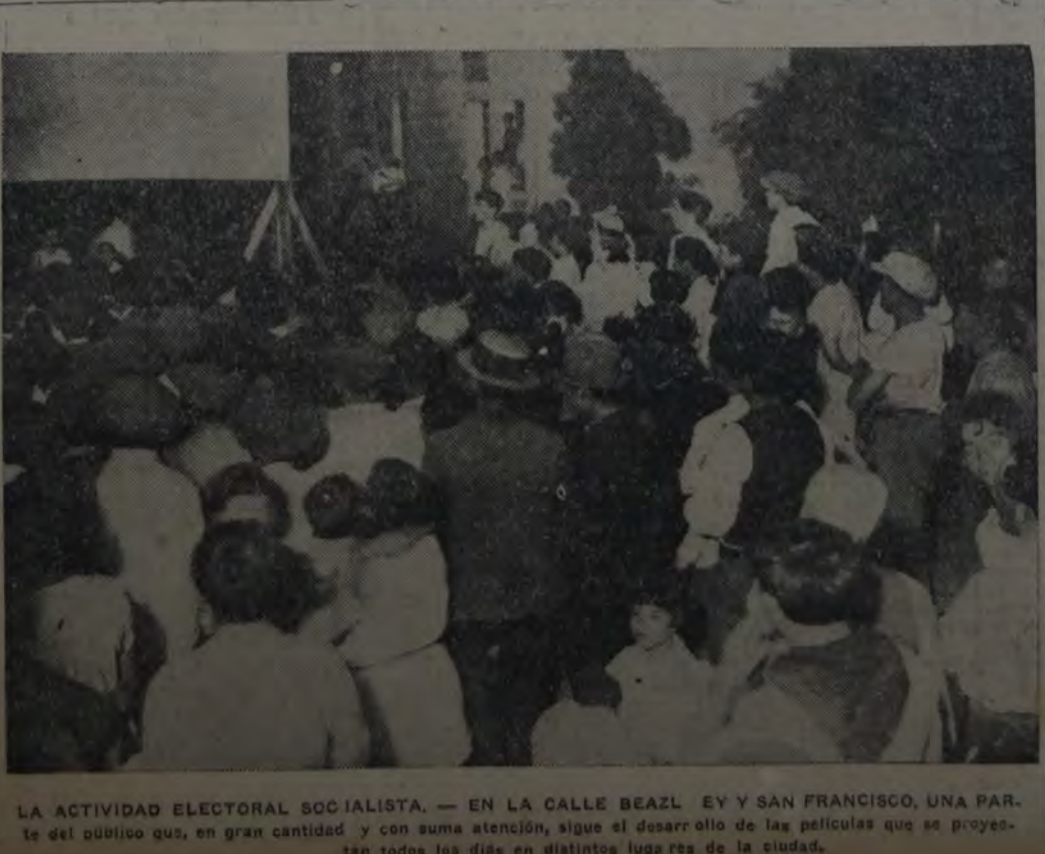
LA ACTIVIDAD ELECTORAL SOCIALISTA. — EN LA CALLE BEAZL, EY Y SAN FRANCISCO, UNA PARTE del público que, en gran cantidad, sigue el desarrollo de las películas que se proyectan todos los días en distintos lugares de la ciudad.