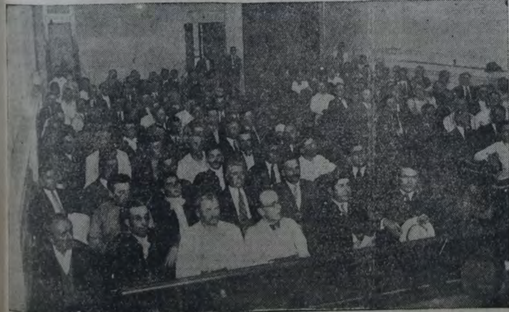
VISTA DE LA IMPORTANTE ASAMBLEA REALIZADA AYER POR LA SECCION BUENOS AIRES SUD.

Reunidos los obreros horas después en el local de la Unión Ferroviaria, sección Buenos Aires Oeste, calle Agüero 68, con la intervención de la C. E. seccional, resolvieron reanudar hoy sus tareas, prosiguiendo las gestiones por la solución del asunto motivado del conflicto por intermedio de