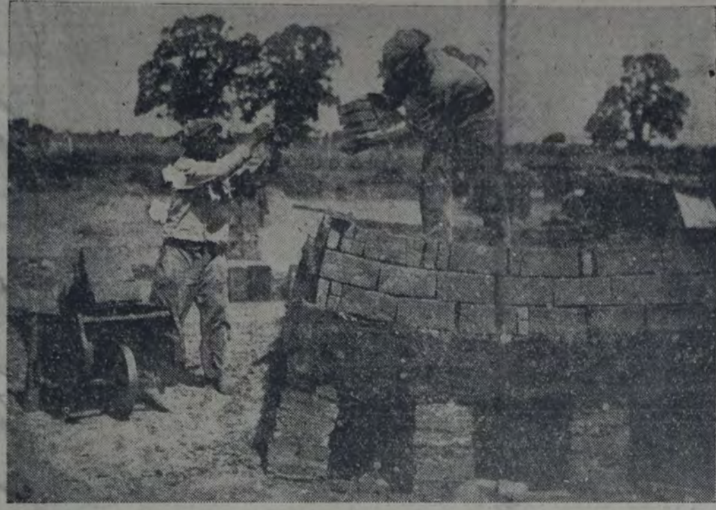
EL TRABAJO EN LOS HORNOS DE LADRILLOS. — TAREA PENOSA SOBRE TODO EN LA EPOCA de verano, cuando el obrero debe realizarla sufriendo todo el rigor de la temperatura. Véase la interesante nota que sobre este aspecto del trabajo se publica en la página 6 de esta misma edición.