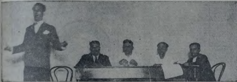
MIEMBROS DE LA C. E. SECCIONAL PRESENTES EN LA REUNION.

Resistiendo a las pretensiones de la empresa del F. C. O. de poner en